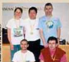
Shearman &amp; Sterling LLP